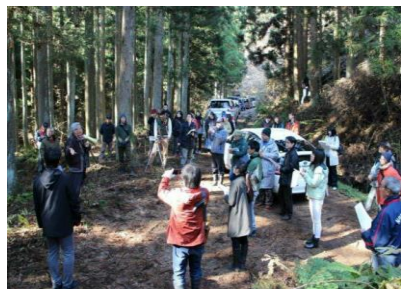
里山管理現場の見学 (第3回ダイアログ)