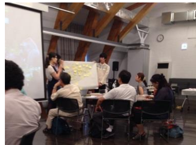
グループワークの成果発表 (第1回ダイアログ)